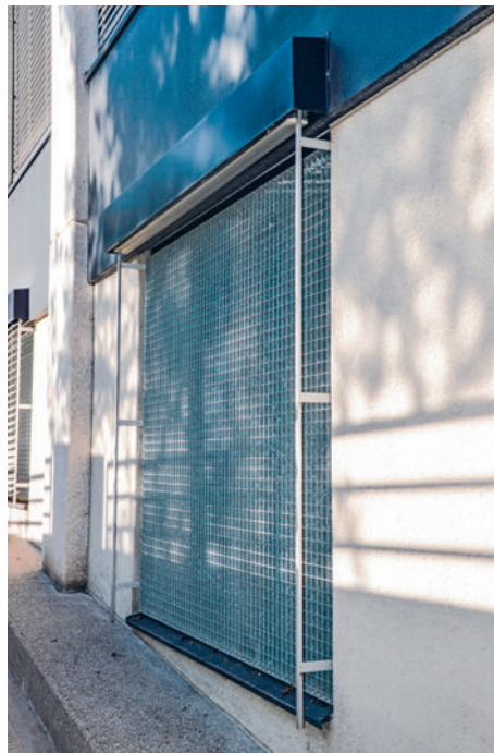
Die Gesamtfläche misst nahezu 5 \text{ m}^2 . Als Stabilisator kam ein Randwinkel zur Anwendung.

Aufgrund der überdimensionalen Abmessungen bildete die Verzinkung im warmen Bad eine entsprechende Herausforderung. Sprich war sich dessen bewusst und verwendete als Randprofil einen starken, umlaufenden Stahlwinkel, welcher direkt mit den Trag- und Querstäben